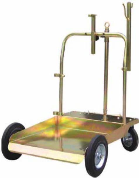
Part Number: 340341